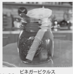
ピネガービクルス(イメージ)

最近、注目を集める発酵食品。発酵の仕組みとおいしさの秘密は何なのでしょう。世界の様々な発酵食の歴史や効果などを、試食と一部調理を交えながら学びます。