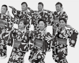
みんなで楽しく!盆ダンス

振り付けを素敵に覚えて、櫓(やぐら)の上で踊ってみませんか。男性女性関係なく、どなたでも気軽に踊りを楽しめます。