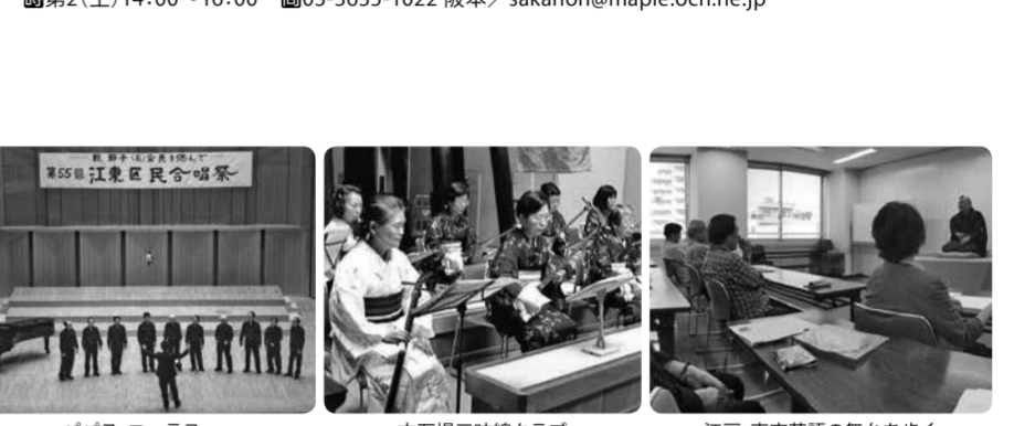
フルート教室 フルメリア 下町写真倶楽部 古石場ムービー倶楽部 江戸・東京落語の舞台を歩く

江戸・東京落語の舞台を歩く 落語芸術協会真打 橋 / 圓満落語とその斬の解説を伺い、翌月に圓満師匠と共に斬の舞台を検証するというユニークで楽しい講座です。 毎月2(土)14:00~16:00 03-3635-1022 坂本 / sakahon@maple.ocn.ne.jp