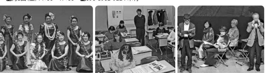
トロスダンスサークル ブアナニ高橋 ハワイアンフラ豊洲 薫書会書道教室 朗読グループ「座・深川」

朗読グループ「座・深川」 メンバーのみで活動 民話・文芸作品・詩など、声を出して楽しく学びます。音楽やスライドを入れた舞台での発表もしています。 毎月2回(土)14:00~17:00 090-8902-9224 木村