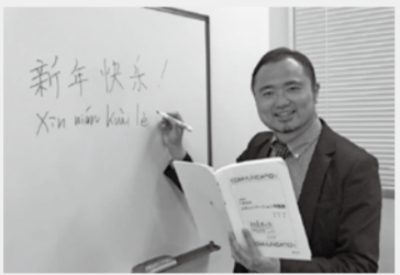
新年快楽 XIN NI HAO!

ビジネスを含め、多方面で中国語の需要が増えています。本講座では中国語学習のポイントとなる発音や実践的な会話練習を中心に中国語を基礎から学び、また中国の文化・習慣等の理解も深めていきます。