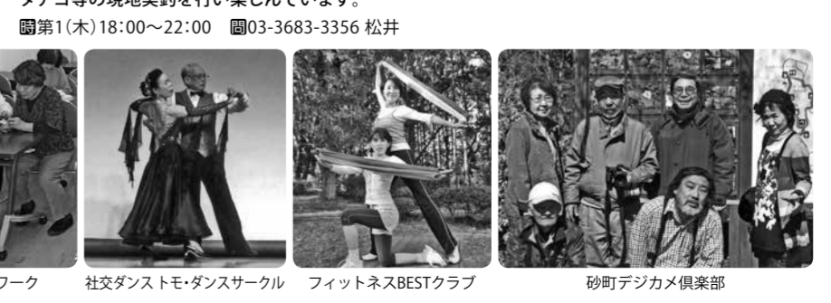
ハーモニカ・ハーモニー 琉球三線愛好会 ちんだみーず 社交ダンス トモ・ダンスサークル フィットネスBESTクラブ 砂町デジカメ倶楽部

釣楽会 メンバーのみで活動 初心者から中級くらいまでの釣り好きの集まりです。メンバーのみで活動し、月1回の釣行会や研究、釣り談義とみんなで楽しく過ごしています。その他に、他の会の人達と一緒にフナ、ハゼ、ヤマメ、ウミナガゴ等の現地実釣を行います。楽しんでいきます。 毎月1(木)18:00~22:00 03-3683-3356 松井