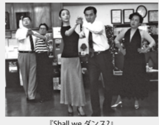
『Shall we ダンス?』 ©1995 KADOKAWA 日本テレビ 情報誌のメディアパートナーズ 日版

『Shall we ダンス?』など日本映画界でヒット作を生み出し続けている映画プロデューサーから、映画化する題材の見つけ方など、撮影秘話を伺います。