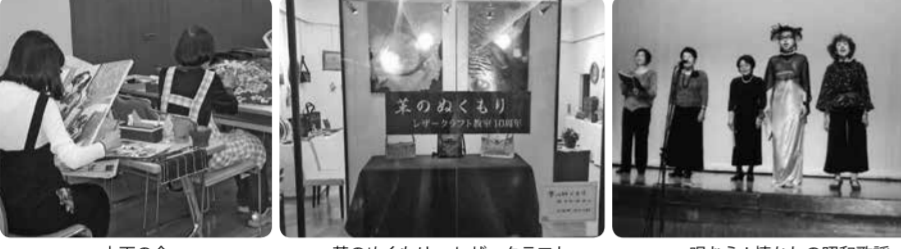
土画の会 革のぬくもり〜レザークラフト 唄おう！懐きの昭和歌謡

〜革のぬくもり〜レザークラフト 日本手芸指導協会師範 田中外美子 天然、エコを代表する革を使い、生活に密着した小物、オリジナルバック、装飾品、リメイクと広範囲の作品を主に手縫いの技法で作っています。 毎月1・3(土)14:00~16:00 090-5313-3093 小美野