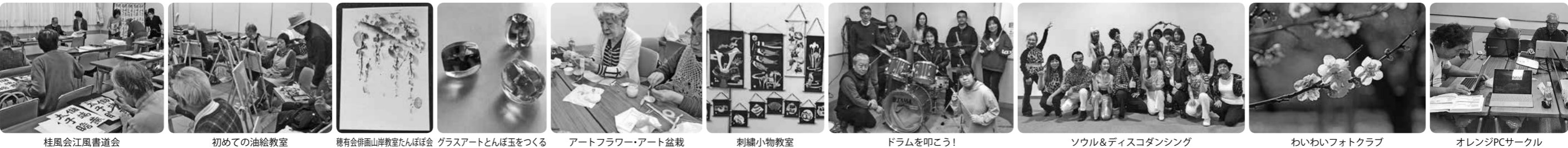
桂風会江風書道会 初めての油絵教室 穂有会俳画山岸教室たんぼぼ会 グラスアートとんぼ玉をつくる アートフラワー・アート盆栽 刺繍小物教室 ドラムを叩こう! ソウル&ディスコダンス わいわいフォトクラブ オレンジPCサークル

香りを楽しみながらセルフケア アロマ・ハーブコーディネーター、健康管理士 矢野真与 体の仕組みや健康情報などを頂き、アロマセラピーの精油やハーブスパイスなどの自然の香りを楽しみながら、セルフケアなどで日々の生活の中で使いこなせるようお伝えしています。香りのクラフト作りも毎回あります。 【第3(水)】10:00~12:00 ☎080-5658-5142 矢野 / rosmarinusgarden@gmail.com