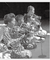
はなかめまつり出演の様子

伝統楽器のひとつ「鼓(つづみ)」を習ってみませんか。※7/12(日)はねかめまつりでの成果発表、8/10(月・祝)演劇公演「ウラシマコタロウ」に出演の予定あり。