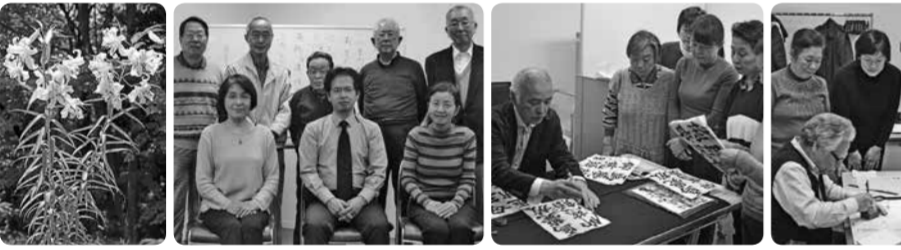
サークル花と木「花を見つけに〜」 古文書サークル 一玄会(書道) 豊洲篆刻同好会 Q-sai 豊洲ギター道場 トロスダンスサークル