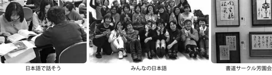
日本語で話そう みんなの日本語 書道サークル芳園会

香耀会 毎日書道展審査員 花村林香 生涯学習の一環として、書道を通じ自己を高め人間関係を、豊かにする活動を目指しています。 毎月2回(木)10:00~12:00 03-5609-3763 矢野