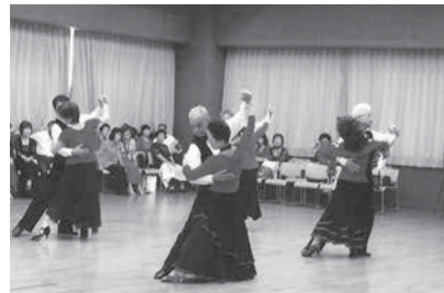
トモ・ダンスサークル