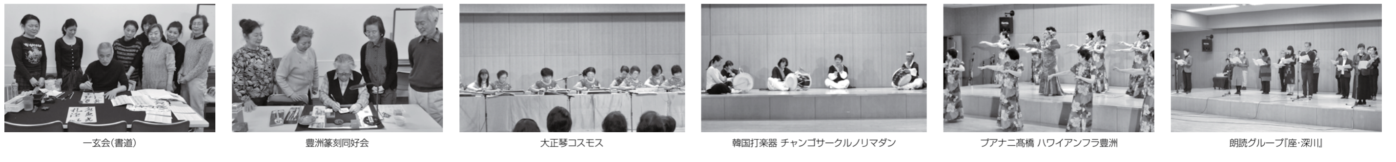
一玄会(書道) 豊洲篆刻同好会 大正琴コスモス 韓国打楽器 チャンゴサークルノリマダン ブアノニ高橋 ハワイアンフラ豊洲 朗読グループ「座・深川」