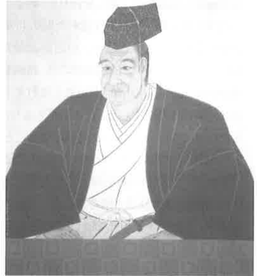
松平定信 55 歳肖像

安永3年(1774)陸奥国白河藩主・松平定邦の養子となり、やがて天明7年(1787)に老中首座となって、天明の飢饉後の幕政のリーダーとして諸政策を推進していくこととなります。定信が致仕(引退)する文