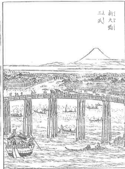
『江戸名所図会 新大橋三派』

向かって左が深川です。絵中央の中洲によって三股がつくられています。月見や納涼の名所となり、茶店などで、にぎわった時期もありました。