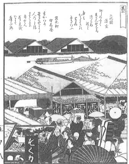
『絵本隅田川兩岸一覽』葛飾北斎画 御船蔵の屋根が連なっています。