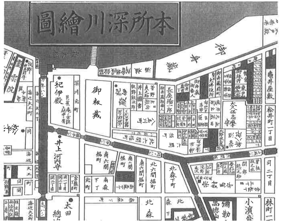
【本所深川繪圖】(文久2年 1862) 御船蔵・初蔵と新大橋・万年橋

現在の位置へは、明治45年(1912)に移りましたが、橋のたもとには当時の街灯が残されてい