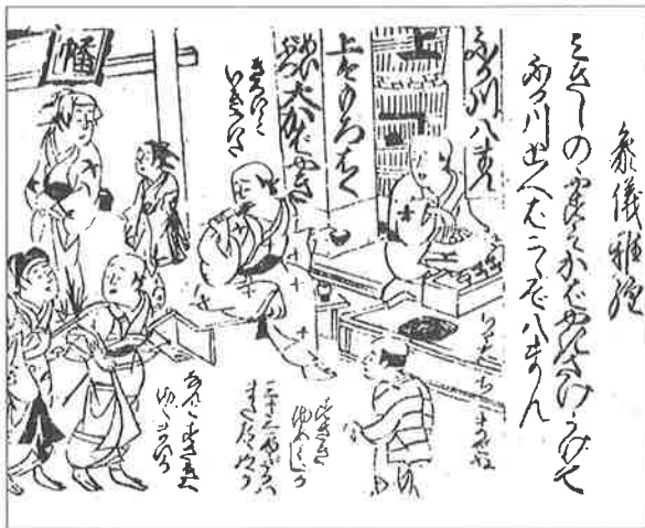
『江戸名所百人一首』

享保年間（1716～1735）に活動した近藤清春の『江戸名所百人一首』には、八幡前の蒲焼きの様子が描かれています。