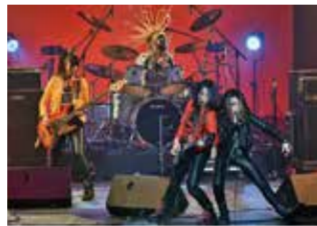
第11回グランプリ受賞バンド『LIPSTICK』

江東区文化センター 03-3644-8111 FAX.03-3646-8369 135-0016 東陽4-11-3