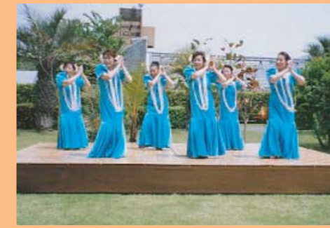
ブアナニ高橋・ハワイアンフラ東大島