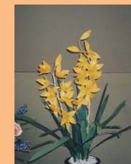
アートフラワー「コスモスの会」