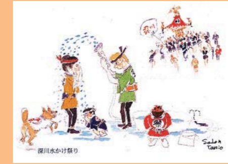
すがのたみおスケッチ教室