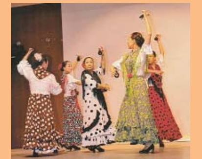
フラメンコサークル・アレグリアス