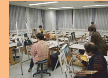
絵の会「キャンバス」