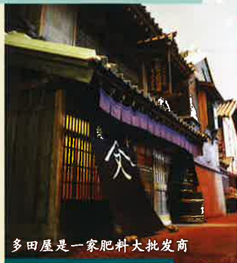
多田屋是一家肥料大批发商