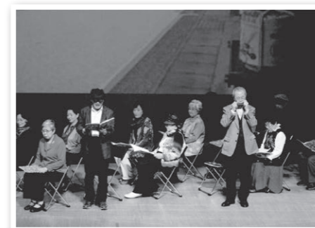
朗読グループ「座・深川」