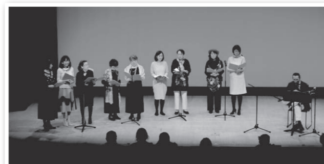
Moulin Rouge ムーラン・ルージュ