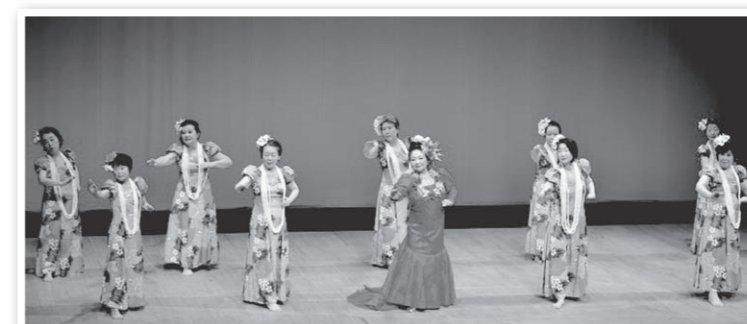
ピアノニ高橋ハワイアンフラ豊洲