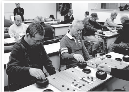
豊洲囲碁サークル