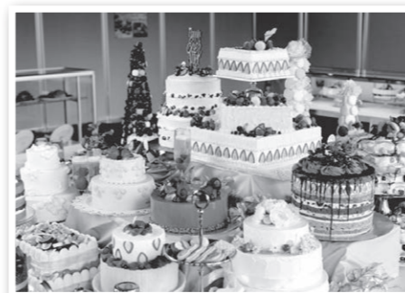
フェイク・スイーツカフェ