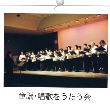
童謡・唱歌をうたう会