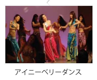
アイニーベリーダンス