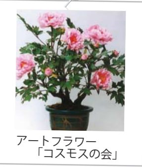
アートフラワー 「コスモスの会」