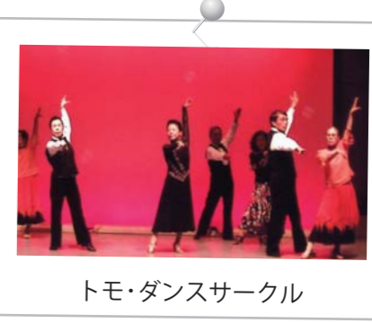
トモ・ダンスサークル