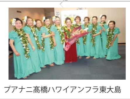
プアナニ高橋ハワイアンフラ東大島