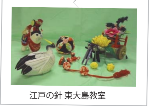
江戸の針 東大島教室