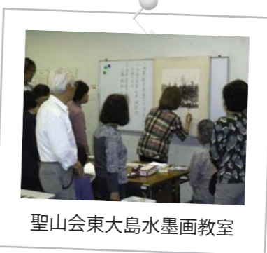
聖山会東大島水墨画教室