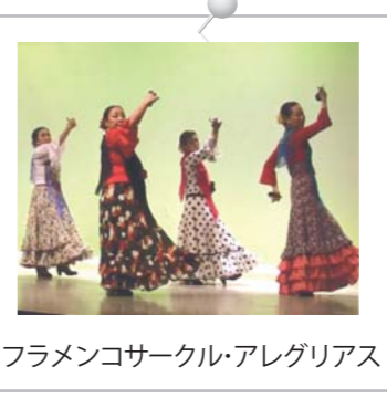
フラメンコサークル・アレグリアス