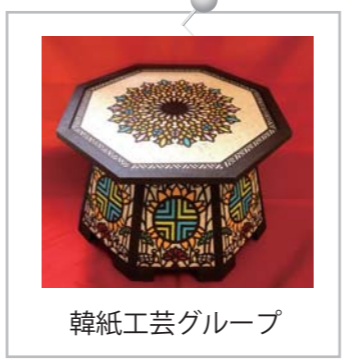
韓紙工芸グループ