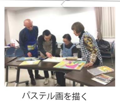
パステル画を描く