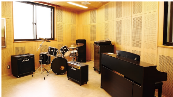
音楽スタジオ (1階別棟)