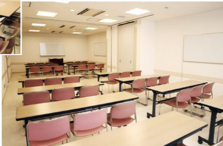
第2研修室・第3研修室 (連結した場合)