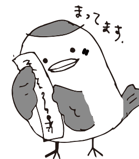
はこべらすずめちゃん

名前は「砂町」生まれのマッチだから。好きなことは砂町文化センターのイベントや講座に参加することと砂町銀座商店街の買い物。