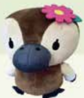
コトミちゃん ぬいぐるみ 約18cm(体長) 1,200円

水彩都市・江東区の魅力をPRする"水辺のアイドル"として大人気のコトミちゃん。そんなコトミちゃんのかわいいオリジナルグッズを販売しています。その一部をご紹介します!