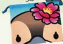
きんちゃく(マチ無) 約228mm×193mm 700円 ※在庫限り!