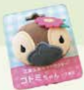
コトミちゃん ぬいぐるみバッジ 約4.0×5.0cm 450円