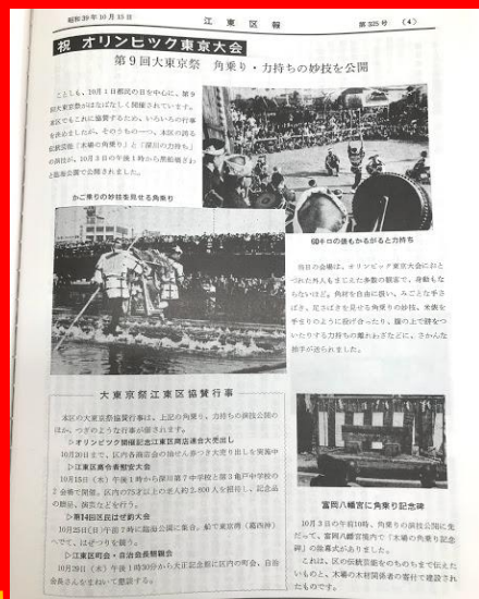
昭和39年10月15日発行江東区報