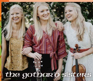
the gothard sisters

2018年に初来日しその楽しいステージで日本のファンを圧倒したアメリカ在住の三姉妹。楽しさあふれるヴァオリンやホイッスルの音色、心温まる姉妹の息のあったハーモニーをお楽しみください。