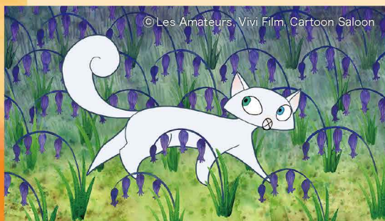
© Les Amateurs, Vivi Film, Cartoon Saloon