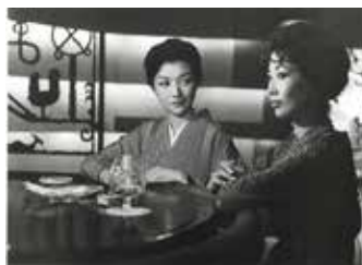
『女が階段を上る時』。1960 東宝