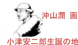
小津安二郎生誕の地

門前仲町駅を降りて賑やかな仲町通り商店街を抜けると、見えるのは成田山東京別院・深川不動堂。日々たくさんの方が行き交うこの場所で、実は様々な祈りの体験が出来るのをご存知でしたか？