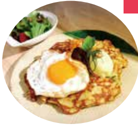
たまごのトッピングつき 「カフェおこ」