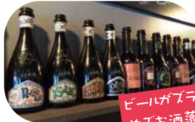
ビールがズラ〜と 並ぶお酒落な店内

種類豊富に取り揃えた Birreria KAPPA で はイタリアのビールを中心に、ワインも 100種類以上取り揃えています。流行のク ラフトビールや、オレンジピールやぶどう の果汁で作った珍しいフレーバーのビール まで、普段ビールを飲まない方でも楽しめ ます。お気に入りの一杯を見つけよう♪