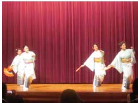
千穂徳の会〈日本舞踊〉

2月13日（日）、古石場文化センター自主グループ・利用団体による日頃の練習の成果を発表する成果発表会を開催しました。今回は3団体 『千穂徳の会』〈日本舞踊〉・『フルーツ教室フルメリア』・『LIKO HULA（リコフラ）』〈ハワイアンフラ〉が出演し、コロナ禍でふさぎがちな気持ちを明るくさせるようなすばらしいステージとなりました。ご参加ご観覧くださった皆様ありがとうございました♪