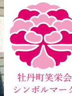
牡丹町笑栄会 シンボルマーク

いちおしのタンメンはスープが絶品です。チャーハン・餃子などテイクアウト承ります!