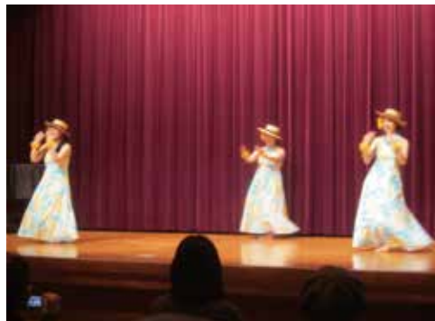
LIKO HULA（リコフラ）〈ハワイアンフラ〉