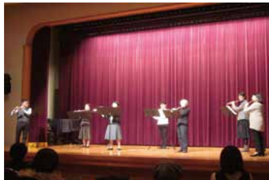
フルーツ教室フルメリア