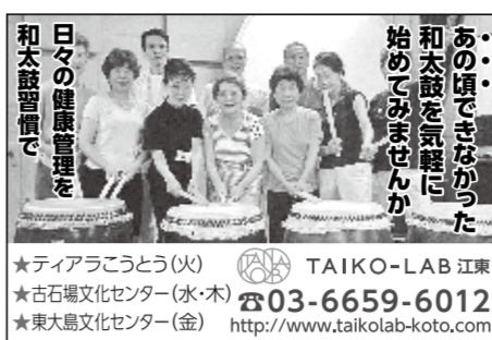
和太鼓の健康管理を始めてみませんか

韓国語講座 東大島、西大島で入門クラス開講中 やさしく楽しい英会話 1/20(金)10:00~12:00