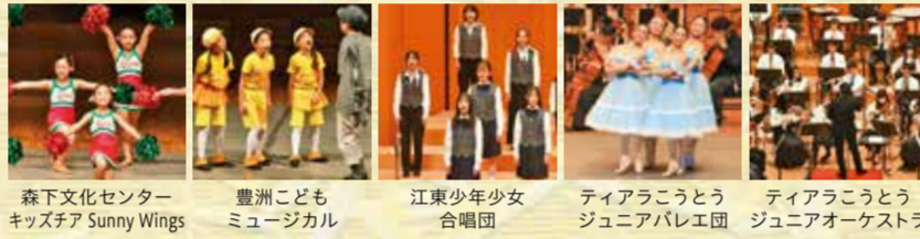
森下文化センター キッズシア Sunny Wings 豊洲子どもミュージカル 江東少年少女合唱団 ティアラこうとうジュニアバレエ団 ティアラこうとうジュニアオーケストラ