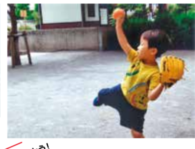
弟が投げた一球夏へ飛び

俳句と写真のコラボレーション作品を募集した「こども江東歳時記」第8回は329作品の応募がありました。その中から、「江東歳時記」賞他、受賞作品が決定しました。