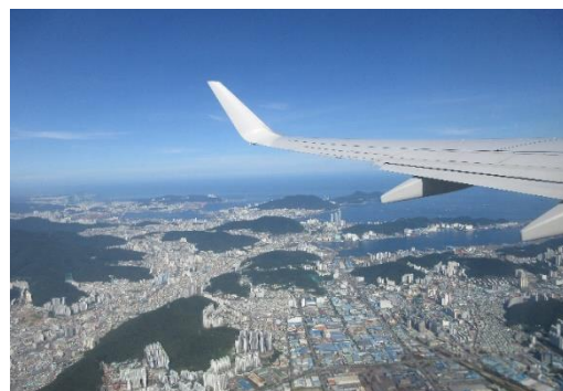
上空より眺める釜山の街並み