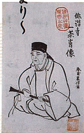
俳諧寺一茶肖像「一茶句集」所収

※FAXの場合は、①講座名 ②氏名・フリガナ ③〒・住所 ④電話番号・FAX番号⑤生まれ年 (西暦)・性別を必ず明記してください。