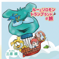
「ルーとソロモン ドラシブランドの 旅」

主催 ムーンライティング 問い合わせ先: moonbam86@gmail.com