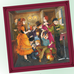
はみだしっ子 パーティー ハンカチーフ