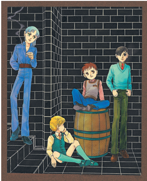
「つれて行って」第24回扉 [1981]