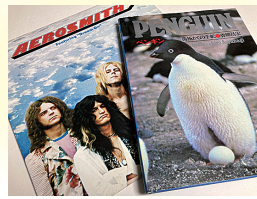
ご遺品の本・レコード