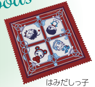
はみだしっ子 メガネ拭き