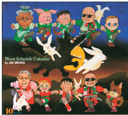
2025年に新たに所在が判明した原画 「ムーンスケジュールカレンダー」 [1988]