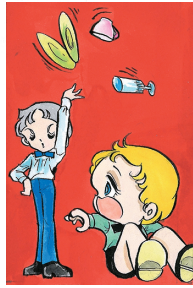
「夢をごらん」前編 予告カット [1976]