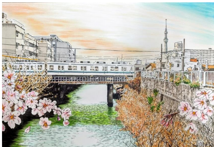
沖山潤氏作品「北十間川・東武亀戸線桥梁」