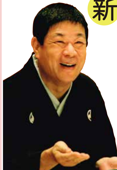
スペシャルゲスト