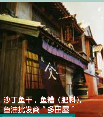
沙丁鱼干, 鱼糟(肥料), 鱼油批发商“多田屋”