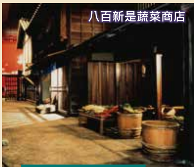
除了新鲜蔬菜以外, 还有咸菜, 蒟蒻, 蛋类等