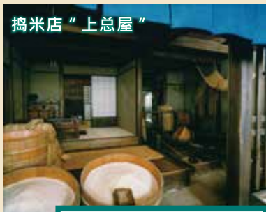
把从大米批发店买进的糙米用碾米机磨成精米卖给一般老百姓。