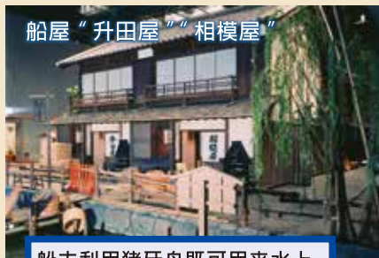
船夫利用猪牙舟既可用于水上运输, 又可用于提供餐饮。前者可载客或运送货物, 后者可提供小吃, 举办宴会等。

此建筑是用来保护城区受火灾影响的。最上层设有吊钟, 发生火灾时有专人敲钟通知全城的人。