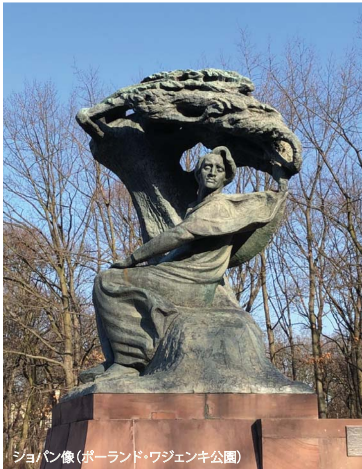
ショパン像(ポーランド・ワジェンキ公園)