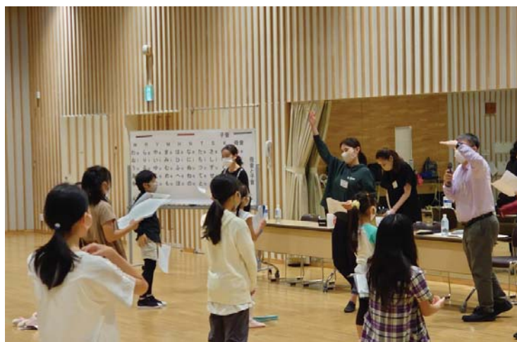
レッスンの様子(演技)