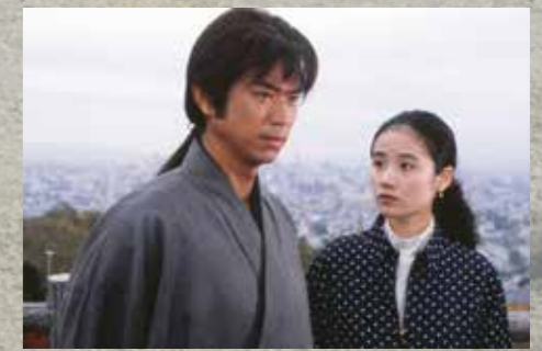
『バック・トゥ・ザ・フューチャー』 『あ・うん』 『秋日和』 『河内山宗俊』 『おはん』 『満月 MR.MOONLIGHT』