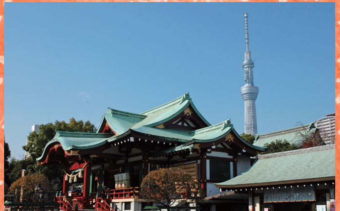
亀戸天神社と東京スカイツリー

昨年3月の東日本大震災による節電へのご協力など、利用者皆さまには大変なご不便とご協力をいただいたことに対して、改めてお詫言と感謝の気持ちを述べさせていただきます。