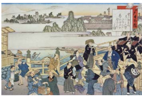
【東海道名所藤栗毛画帖】 (江戸日本橋)

本紙 カルチャーナビKOTO 平成24年度広告募集 詳しくは江東区文化センター(☎3644-8111)までお問い合わせください