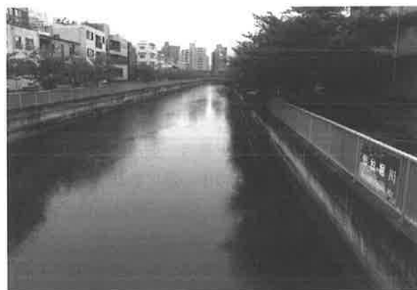
図2 現在の仙台堀。木更木橋より東方

仙台堀の川幅は20間(約36m)、油堀は15間(約27m)です。こうした川幅の広い運河には枝状の小河川が作られて、掘割同士を結び、地域全体の掘割が一体化して河岸地や船の繫留 けいりゅう などに使用されました。こうして当初は材木置場の貯木・輸送用に開かれた掘割が、東方の土地造成・材木置場移転によって延伸され、「掘割網」が形成されて深川にあらゆる物資が集積し、「江戸の蔵」としての役割を担うきっかけとなりました。