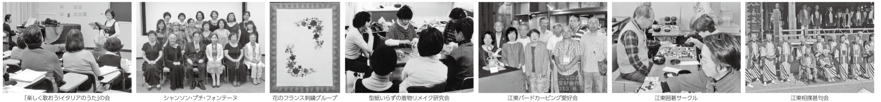
[楽しく歌おう!イタリアのうた]の会 シャンソン・プチ・フォンテーヌ 花のフランス刺繍グループ 型紙いらずの着物リメイク研究会 江東バードカービング愛好会 江東囲碁サークル 江東相撲撲句会