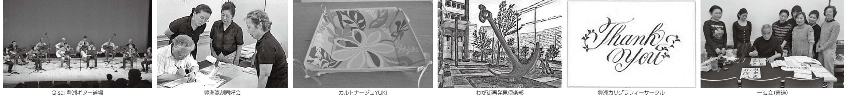
Q-sai 豊洲ギター道場 豊洲篆刻同好会 カルトナージュYUKI わが街再発見倶楽部 豊洲カリグラフィサークル 一玄会(書道)