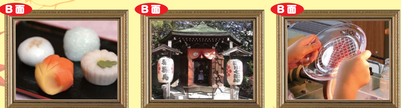
五感で楽しむお菓子 亀戸文化センター