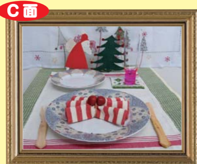
ヨーロッパの美味しい食卓 ～北欧のクリスマス～ 総合区民センター