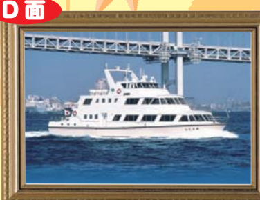
江東区を知らう！～防災・環境編～ 江東区文化センター