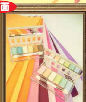
アンチエイジング ～自分らしく輝くために～ 東大島文化センター