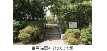
亀戸浅間神社の富士塚