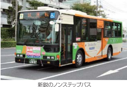
新鋭のノンステップバス