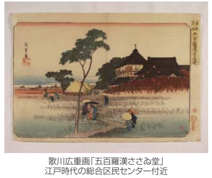
歌川広重画「五百羅漢さあさび堂」江戸時代の総合区民センター付近

私たちの住む東京という町の成り立ちや、東京の下町情緒とは何かを知ろうとするとき、見過ごして通ることのできない「江戸の生活」について学びます。講師は、NHKテレビ時代劇の時代考証を数多く手がける、江戸町人研究会の重鎮です。時代考証の難しさを、面白さを大いに語っていただきます。