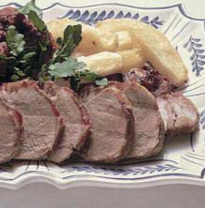
ローストポーク(イメージ)