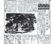
早稲草野訪記 江戸川乱歩

昔読んだ小説。タイトルだけ知っている小説。名作文学の数々を読んでいくこの講座。明治から始まり、今回の昭和後編で一区切り。毎回一作家、一作品を取り上げます。最終回はゆかりの地を歩きます。 11/17 太宰治「新八木」 12/15 谷崎潤一郎「細雪」 1/19 三島由紀夫「禁色」 2/16 江戸川乱歩「名探偵一休探偵」 3/15 文学散歩 馬込文士村 早稲草野訪記 江戸川乱歩