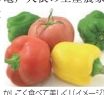
かきこく食べて美味しく(イメージ)

食に関する資格として注目の野菜ソムリエ(日本野菜ソムリエ協会認定)が旬の野菜や果物の品種の違い・選び方や保存方法などを紹介します。また、最終講義では江戸東陽産の亀戸大根の生産農家を訪ねます。日頃食べている野菜や果物をもっとおいしく、かきこく食べるコツを学びましょう。