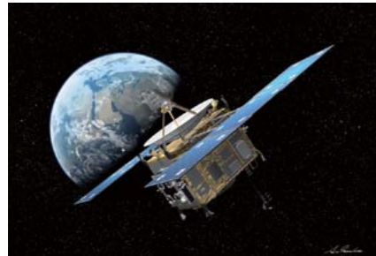
小惑星探査機「はやぶさ」イラスト:池下卓将