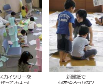
スカイツリーを作ってみよう! 新聞紙で何をやるのかな?

なぜこんな絵を描くの?なぜこんな物を作るの? こどもの作品は不思議で面白いものだらけです。本講座では、親子でスカイツリーを作ったり、巨大な紙にお絵描き、新聞紙を使った遊びなど様々な造形にチャレンジします。 造形を通じて、こどもの心の発育や表現を知り、上手にこどもと付き合う方法も学びます。