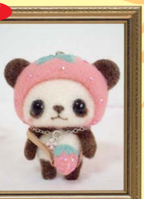
羊毛フェルトの かわいいマスコット 豊洲文化センター