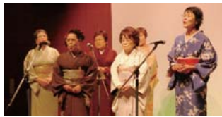
昨年年度発表会より

日本の伝統芸能である民謡。日本各地で歌い継がれてきた民謡を楽しみながら学びます。最終日には、おさらい会として教室内で発表会を実施します。 昨年年度発表会より