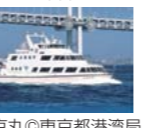
新東陽丸(東京都港湾局)