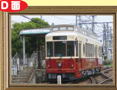
なつかしの都電・都バスと江東区 砂町文化センター