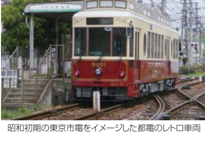
昭和初期の東京市電をイメージした都電のトロコ車輦

江東区と密接なつながりを持つ、100周年を迎えた東京の都営交通。城東電車からはまる、江東区とその周辺の名つかしの都電や、都バスの魅力に迫ります。最終回は都バス車輦を見て、都電の貸切を予定しています。