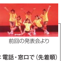
前回の発表会より

リズムに合わせ、ステップやターン練習を重ね、ジャズダンスの基本を学びます。 【まずは体験レッスン!】 現受講生と一緒にレッスンをします。 日時：9月27日(火)、10月11日(火)16:30～17:30 ※どちらか1日をお選びください。 対象：5歳～中学生各回20名 費用：無料 申込：電話・窓口で(先着順)