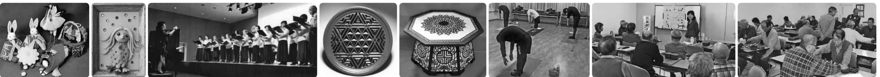
江戸の針 東大島教室

図写真家 中村文夫 デジタルカメラでの撮影を愛好する有志の集まりです。月2回の作品の講評と随時の撮影会を行っています。講師には2ヶ月に1回の指導を受けています。 図第2・4(月)19:00～20:30 090-4664-2754 谷嶋