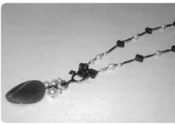
ビーズバラエティ