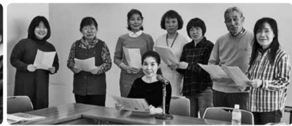
KOTOアナウンス倶楽部