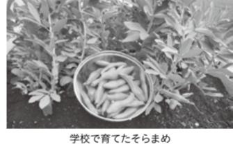
学校で育てたそらまめ