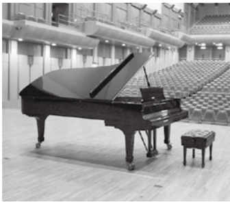
大ホールのスタインウェイ

ティアラこうとうでは大ホール、小ホールにあるグランドピアノを、個人練習のためにご利用いただくサービスを実施しています。なおご利用にあたって、次の条件があります。