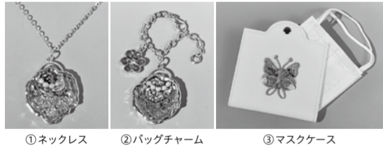
①ネックレス ②バッグチャーム ③マスクケース

大人向けの手工芸教室です。 【5/30(日)10:00～15:00】 【第5会議室】 【電話・窓口で(先着順)】 内容 講師 時間 定員 参加費 ①UVレジンで作るネックレス 宮本輝美 (江東区手工芸協会) 10:00～11:00 各5名 1,000円 ②UVレジンで作るバッグチャーム 11:00～14:00 ③キラキラ風のバッグ風マスクケース 下山弘子 (江東区手工芸協会) 10:00～14:00 各5名 600円