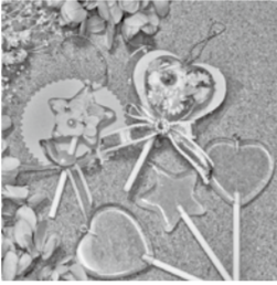
作品例(作成は1つずつ)

る豊洲にぎわい市では、アマチュアハンドメイド作家による体験教室を開催いたします。今月はプラスチック製の小さなロリポップ(棒付きキャンディ)をドライフラワー、プリザーブドフラワーなど、本物の花とキラキラしたビジュで飾ります。かわいらしいラッピングをしてできあがり。 【5/30(日)10:00～15:00】 【シビックセンターギャラリー(1階)】 【どなたでも(未就学児保護者同伴)】 【500円】 【当日直接会場へ(先着順)】