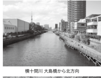
横十間川 大島橋から北方向

「大島旧中川そらまめ祭り」の一環で展示を行います。大島を囲む旧中川、小名木川、堅川、横十間川には、それぞれ違った歴史が流れ、大島の町にとって欠かせない川となりました。その成り立ちや沿岸の歴史について、名所絵や浮世絵、古地図などから紹介します。また、大島の小中学校・幼稚園・都立城東特別支援学校でのそらまめの栽培・成長のようすも展示します。 【5/13(木)～23(日) 9:00～20:00(最終日は16:00まで)】 【展示ホール 無料】 【大島まちづくり協議会 ☎03-3682-2201(遠藤)】