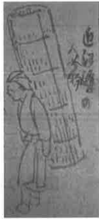
図1 「木曾海道六拾九次之内 高宮」(部分)望月義也氏所蔵(左図) 図2 『スケッチ帖』大英博物館所蔵、菅原真弓氏『浮世絵版画の十九世紀』ブリュックより転載(右図)