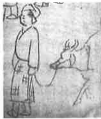
図3 「木曾海道六拾九次之内 恵智川」(部分)望月義也氏所蔵(左図) 図4 『スケッチ帖』大英博物館所蔵、菅原真弓氏『浮世絵版画の十九世紀』ブリュックより転載(右図)

という題とともに描かれています(図2)。また、「恵智川」には牛を引く女性(図3)が描かれており、これも『スケッチ帖』ほぼ同図のスケッチが残っています(図4)。