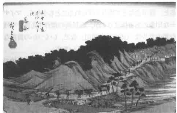
図6 「木曾海道六拾九次之内 落合」望月義也氏所蔵

旅の見聞を活かした作品の絵画的な評価は必ずしも高いとは限りません。それでも、広重の「写真」に「筆意」を加えるという作画姿勢と広重の独自の画風を生み出すために、旅が一助となっていたと思われます。