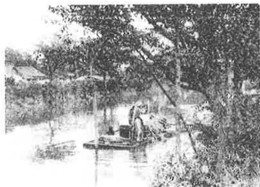
『新撰東京名所図会』東京都公文書館所蔵 (『江東区の文化財』より)

かつての北十間川は人工の河川、運河とは言え、水害のたびに流れを変える自然に近い流れでした(絵参照)。明治43年(1910)の洪水後、現在のように護岸が整備されました。以前の北十間川を知る近所の方の中には、護岸が造られることにより江東区と墨田区という区境の感覚が深まり、対岸との精神的な距離感を感じるという方もいます。それまでは、亀戸村としての一体感が残っていたのかもしれない。