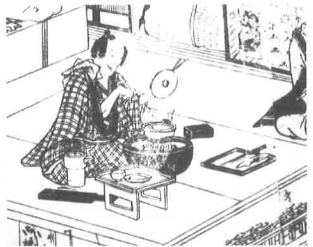
『当世七癖上戸』さし絵（名古屋市蓬左文庫蔵） すわっている男性のひざの前には酒の入った「ちりり」。 火鉢にかけた鍋で一人分の食事を作る情景。

明治になり、アルミの釜がで、やがて昭和30年（1955）に電気釜が誕生します。釜の表面の底はすすが付くので手入れしなければならず、うっかりすれば服を汚してしまうといった主婦の苦労が一気に解消された大発明でした。