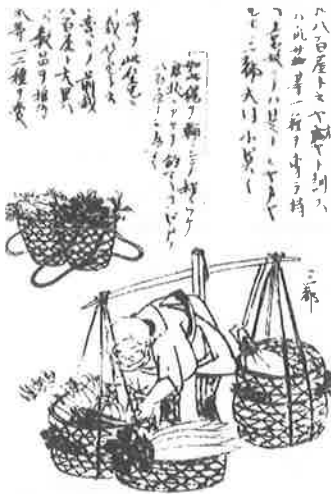
『守貞漫稿』にみる前栽売り

喜田川守貞『守貞漫稿』に、「俗に三都とも八百屋と云ふ。やおやと訓ず。また江戸にては、瓜・茄等一種を専ら持ち巡る者を前栽売り」と云ふ」という記述がみられます。天秤棒を担いで野菜を売り歩く行商のうち、一種か数種の野菜を売り歩く野菜売りを前栽売りといいました。前栽は屋敷の庭や植え込みの植栽をさ