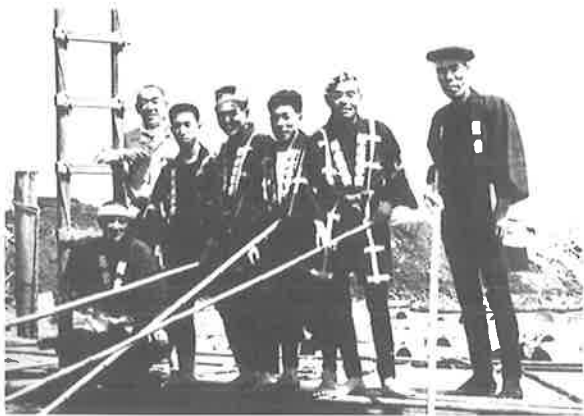
深川木場川並の仕事着 関東大震災(大正12年)前後 江東区教育委員会生涯学習課文化財係蔵

◆職人・行商人に、股引に着物の尻からげスタイルが定着。◆動きやすく、一反で2枚作れる袖無し羽織が流行。◆江戸市中一般の女性が上着に黒繻子の半襟を掛ける(擦り切れ・汚れ防止)。◆前垂(前掛)が広く用いられる(汚れ防止)。