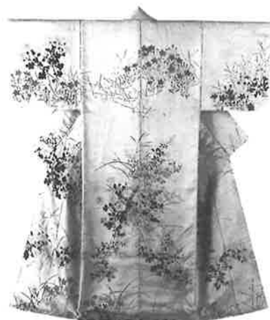
冬木小袖〈白綾地秋草描絵小袖〉 宝永頃 東京国立博物館蔵