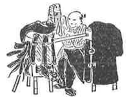
竹馬の古着売 (『守貞漫稿』より)

お家「アイサ。路考茶か、鼠か、伊予染さ。みんな昔流行ったそうだが、段々流行返るのだ」