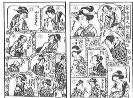
女湯の登場人物たち

⑧おしやべりかみさま⑨嫁田舎からできた下女 ⑩よく気がつく女房⑪女衞者 ⑫御新造さん(裕福な商人の妻) ⑬けつこうな(好人物)婆さま⑭常本節を語る女