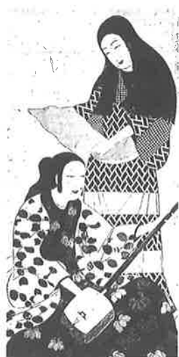
松浦屏風(部分) 江戸初期寛永頃の女性

町と共に衣服も焼けてしまったため、安土・桃山時代からの衣生活が一変します。皮は防火用の火事羽織などに使用のため値段が高騰し、木綿足袋が普及。更に金襴などの金を使う武家階級の重厚な幅広小袖時代が終わりを告げました。かわって金銀装飾でなく、柔らかく軽い りんず 縮緬 はぶたえ 地に刺繍や染めで花