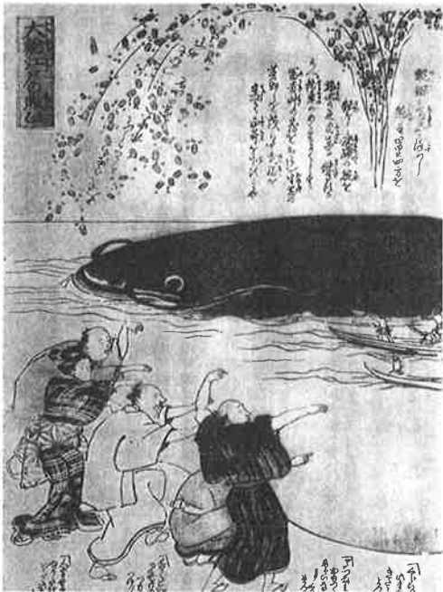
鯨絵① 「大鯨江戸の賑わい」

また、鯨が暴れるのは鹿島神宮にある要石 かがいし が緩んだときであるとされ、鯨絵②はその要石＝神の力によって操られている鯨が登場しています。こ