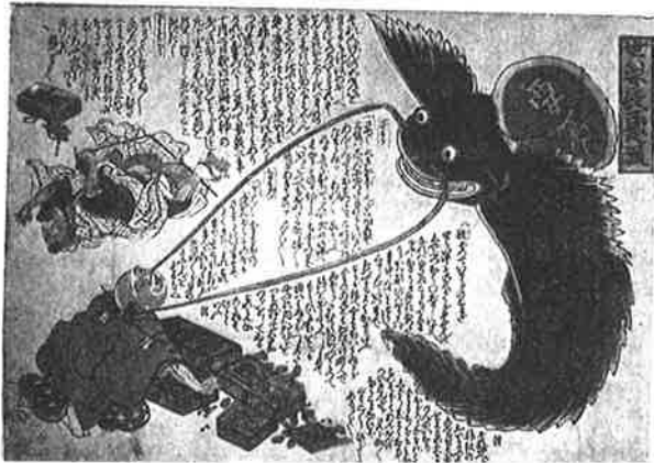
鯨絵② 「世八安政民之賑」

また、鯨が暴れるのは鹿島神宮にある要石 かがいし が緩んだときであるとされ、鯨絵②はその要石＝神の力によって操られている鯨が登場しています。こ