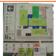
倉庫の屋上にコートが5面も！ 老若男女、日夜汗を流しています。

【サマデイ江東・森下】 江東区森下三ー十二ー七 丸八倉庫屋上 〇三(五六二五)六八〇一 ※電話受付時間は、曜日により 異なりますので、ホームページで ご確認ください。 URL: http://www.samadclub-tennis.jp/