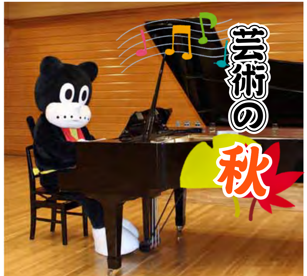
4F 第1レクホールでは、グランドピアノのご利用ができます(有料)。