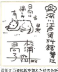
深川江戸資料館を訪れた時の色紙 深川江戸資料館

読者を江戸時代へと誘ってくれる、杉浦日向子さんの作品は、当時の風景や人びとの暮らしを身近に感じさせてくれます。特別展では、挿絵、漫画作品や関連資料を展示。その仕事を紹介しながら深川との関係にもスポットをあてます。江戸深川の町並みを再現した常設展示とあわせて江戸の魅力に浸ってください。