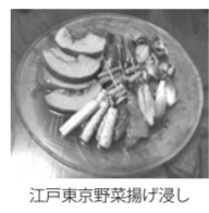
江戸東京野菜園が採り

◆「江戸東京野菜のルーツと味」 「江戸東京野菜」について、そのルーツを講義で学びます。最終回は実際に野菜を使って調理実習し、個性豊かな味わいを楽しみます。 1/16, 2/20, 3/20すべて(水)