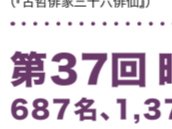
「芭蕉俳句」 (「古今俳句二十六俳仙」)

芭蕉ゆかりの地・深川で初となる国際英語俳句大会です。英語俳句にチャレンジしてみませんか。※申込み等の詳細はホームページへ https://www.kcf.or.jp/basho/touku/ 関連講座を開催します。※詳細は2面