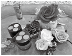
オリジナルのクリーム・スプレー

赤ちゃんにも安心して使える天然アロマを使って、カサカサお肌のための保湿クリームや、お尻ケアスプレーを作ってみませんか? ¥500円～ ◆ハーバリウム キーホルダーを作ろう ガラスドームにお花をオイルで閉じ込めてキラキラ揺れるキーホルダーを作成します。 ¥500円