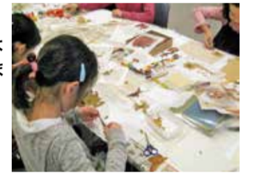
楽しい仕事もあるよ