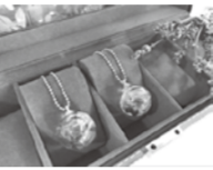
ハーバリウム作品例

総合区民センター 〒136-0072 大島4-5-1 ☎03-3637-2261 FAX.03-3683-0507 (第2・4月曜日休館) 祝日の場合は開館