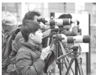
鳥の観察会(イメージ)

川に囲まれた江東区の水辺に親む「TEKUTEKU水辺ウォーク」。今回は、身近に見られる鳥たちを観察しながら歩きます。