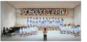
昨年の舞台発表の様子

11/18(日)10:00～ 江東区文化センター 無料 江東区文化センターへ電話・窓口で(先着順) ※独立行政法人国立青少年教育振興機構「子ども夢基金助成活動」の助成事業です。