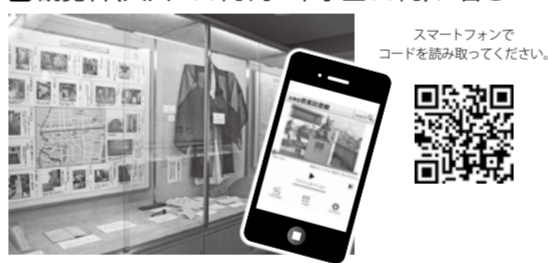
スマートフォンでコードを読み取ってください。

各ブースの展示解説をお手持ちのスマートフォンで聴くことができます。ぜひ展示をご覧になりながらご利用ください。 3階展示室 観覧料(大人200円、小・中学生50円)に含む