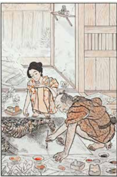
「百日紅」カラー原稿 ©杉浦日向子・MS.HS

現在も多くの人びとに愛されている杉浦日向子さん(漫画家・江戸風俗研究家など)について、その生涯を追うとともに、様々な仕事や作品を紹介。また、著作を中心に、江戸時代の生活や町、食や文化など杉浦さんの描く「江戸」をその視点からご案内します。